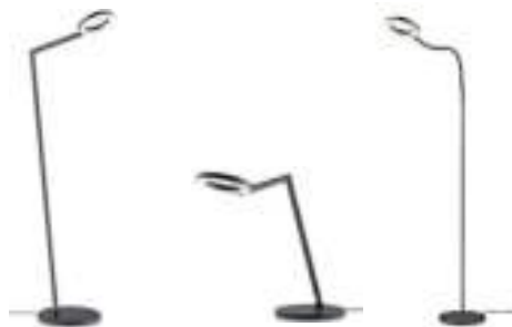
TESSA-S 41.990.xx 17 W LED, 2.200 – 3.500 K, 1.904 lm EEL-F TESSA-T 61.628.xx TESSA-S-Flex 41.991.xx