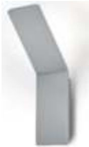
21.851.xx 10 W, 850 lm, 2.700 K EEL-F