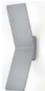
21.852.xx 2 x 10 W, ges. 1.700 lm, 2.700 K EEL-F