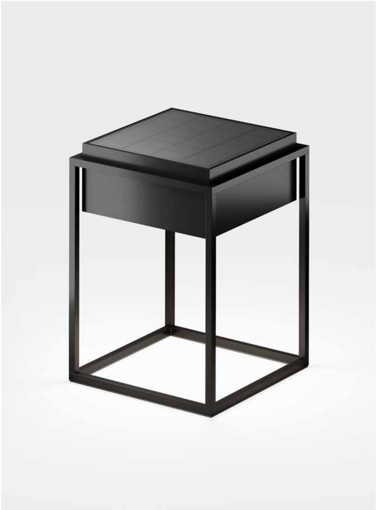
qua Design: Klaus Nolting